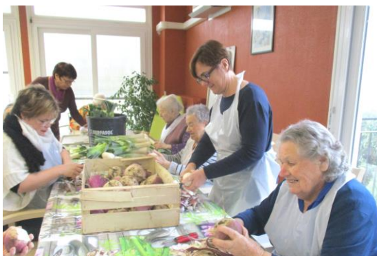
« Epluchage de légumes pour pot au feu à l'occasion du téléthon »

En décembre dernier, les résidents de l'EHPAD de Preuilly ont apporté leur aide à l'organisation du Téléthon dans la commune. L'EHPAD a accueilli dans ses locaux le concours de belote qui a réuni de nombreux joueurs. Le samedi matin, les résidents ont épluché avec entrain les légumes du pot au feu en compagnie de bénévoles du comité des fêtes (une résidente a d'ailleurs exprimé sa satisfaction en disant : « c'est chouette, on se sent utile ! »). Des productions de décors de Noël, de chutney de figues et de bijoux fantaisie sont venues alimenter le stand de vente au profit du téléthon.