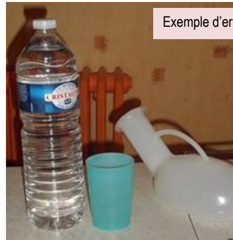
Exemple d'erreur possible

Beaucoup de personnes ont participé à cette journée qui fût une pleine réussite.